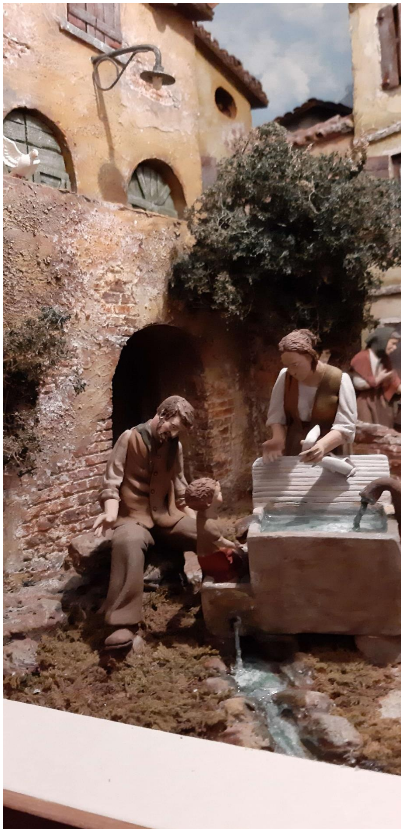
7 - La foto mostra il lampione collocato sul muro di una abitazione tipica di un presepio popolare.